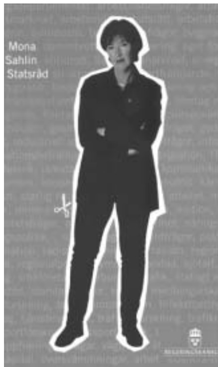
Mona Sahlin – på postkort udgivet af den svenske regering!