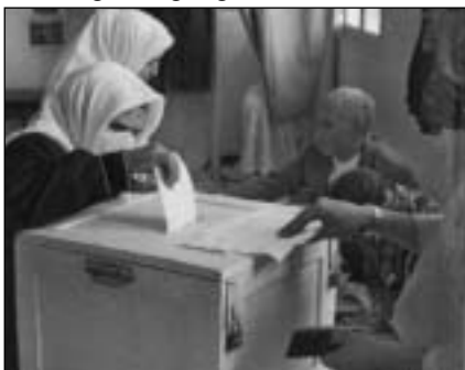
Muslimske kvinder stemmer, men har manden sat krydset?

Nahid Riazi beskriver i »Apartheid mod kvinder og børn i islam«, hvorledes islam er redskabet til apartheid mod kvinder, og at de mandschauvinistiske og kønsfascistiske traditioner ikke blot er en uadskillelig del af Islam, men simpelthen er selve kernen i denne dybt afstumpede tro. Også traditionen med »arrangerede« ægteskaber er ikke blot i overensstemmelse med, men simpelthen obligatorisk i islam. Det er en oplagt fejltagelse at tro, at der skulle være en særlig forskel mellem »arrangerede« og tvangsægteskaber! Indoktrine-