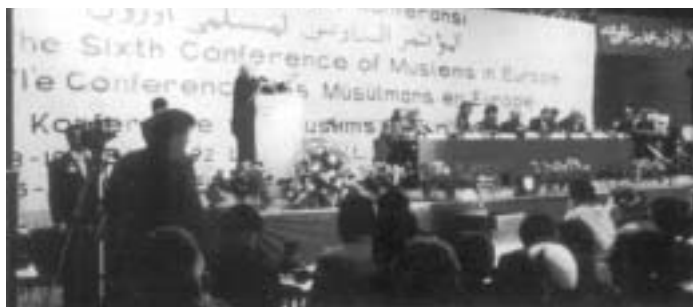
Milli Görüs holder konference for muslimer i Europa

Vi skylder ikke islam noget som helst – den klassiske kultur har Vesten ikke fået overleveret via den islamiske verden, men via det østromerske rige, og desuden overvintrede kulturen i kristenhedens klostre. "Algebra" er rigtigt nok et arabisk ord, men kilden er Indien. Også ordet kemi er dannet af arabisk, men begrebet