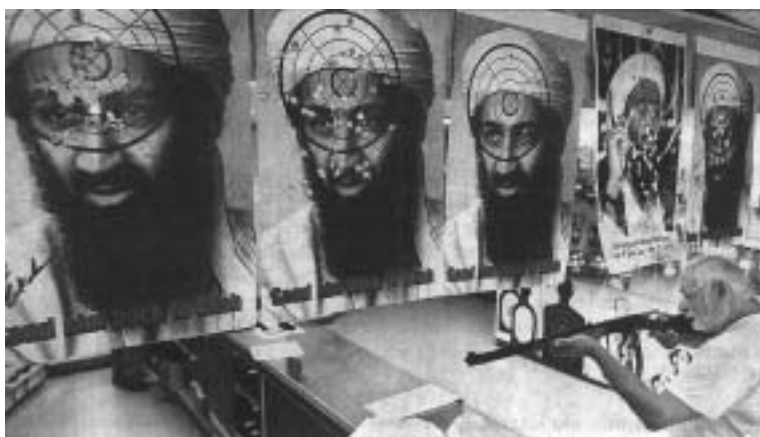
Mon vore kommende "etniske" NATO-soldater ville deltage i denne amerikanske skydeøvelse?

Det seneste udslag af denne politiske korrekthedssyge er oplægget til etnisk integrationspolitik i militæret. Man vil med snart sagt alle midler have flere fremmede