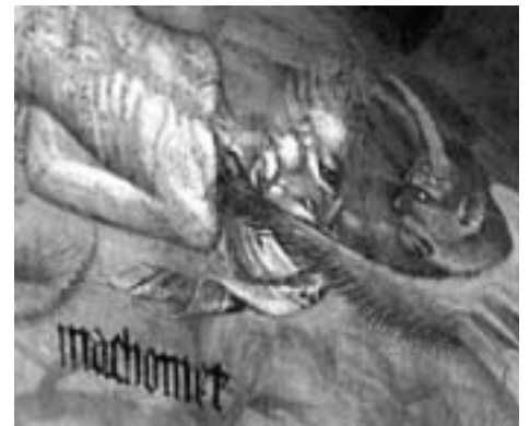
Det middelalderlige maleri af Muhammed i sin helhed ( tv.) og i nærbillede (th.).

Det italienske politi har opdaget, at islamiske terrorister tilknyttet al-Qaida netværket planlagde at ødelægge fresko-maleriet i Bolognas katedral, der forestiller profeten Muhamed i helvede. Politiet opfangede telefonsamtaler mellem nogle tunesere, marokkanere og al-Qaidas hovedmand i Europa, en libyer kaldet Amsa. For fire år siden blev Bolognas katedral besat af muslimske indvandrere i protest mod maleriet.