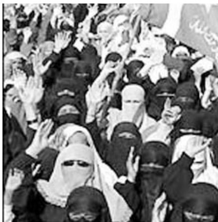
Europas befolkning anno 2100?

foregiver at bekæmpe neofascistiske tendenser, men dets egentlige formål synes at være at kvæle al kritik af den fascistiske »religion« Islam...)