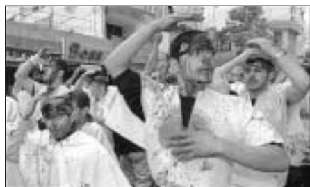
Islamister demonstrerer i Europas gader

Ud fra alt dette bør vel foreløbig konkluderes, at i vor omgang med islam må vi altid lade tvivlen komme den til