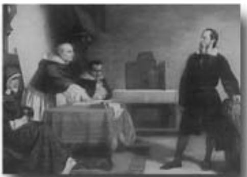
Galilei foran inkvisitionen – som Glistrup 367 år senere.

Dette indebærer, at de politikere, der er hurtigst til at se opkommende ubehageligheder i horisonten, som ikke er flatterende for dem, der er beskyttet af § 266 b, let afskæres fra at advare herimod i samme populære form som de politikere anvender, der ser sig bedst tjent med at dysse det hele ned.