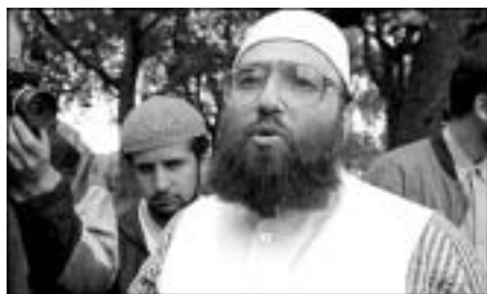
Omar Bakri Muhammed

men som én nation – og at 73% af verdens islamiske grupper åbent går ind for Osama bin Laden. René Marchands islamistiske interviewpartner (af perfekt vestligt velklædt ydre) erklærer, at ved at misbruge værternes pacifisme og minoritetsvenlighed m.m. regner de islamiske krigere med helt at overtage Frankrig i løbet af dette århundrede. Metoden beskrives åbenhjertigt i tidsskriftet for Organisationen for den Islamiske Konference, L'Islam aujourd'hui : "Succesen for en muslimsk minoritet er at en dag blive en majoritet. Dette fænomen lader sig gøre ved den gensidige assimilation mellem den ikke-islamiske majoritet og den islamiske minoritet, hvor majoriteten lidt efter lidt accepterer den islamiske moral og religion og slutter med at identificere sig med islam."