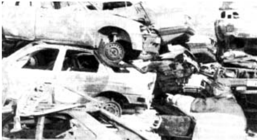
Brændte biler i Strasbourg.

I de "udsatte zoner" (= indvandrerkvarterer) i Frankrig steg kriminaliteten med 66% i 2000 og med 77% i 2001 (88,5% for voldskriminalitet). Kriminologerne Xavier Raufer og Alain Bauer har